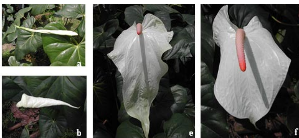
Figura 2. Escala de notas para descrição do estágio de desenvolvimento das hastes florais de A. andraeanum : a - espata fechada visível sobre as folhas; b - menos da metade da espata aberta; e - 2/3 da espádice maduro (ponto de corte); f - mais de 2/3 da espádice maduro.

Figure 1. Scale note describing flower stems development of A. purpuratum varieties: a - inflorescence emission; b - inflorescence fully emitted; c - inflorescence opening; d - inflorescence with 2/3 opened bracts (harvest point); e - inflorescence with more than 2/3 opened bracts.