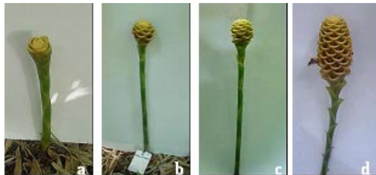
Figura 4. Escala de notas para descrição do estágio de desenvolvimento das hastes florais de Z. spectabilis : a - emissão da inflorescência; b - inflorescência com diâmetro maior que o comprimento; c - inflorescência com comprimento igual ao diâmetro; d - inflorescência com comprimento maior que o diâmetro (ponto de corte).

Figure 3. Scale note describing E. elatior flower stems development stages: a - flower stem emission; b - formation of the inflorescence; c - opening inflorescence; d - under bracts partially opened and central portion closed (harvest point); e - under bracts opened and central portion partially opened (harvest point); f - totally opened.