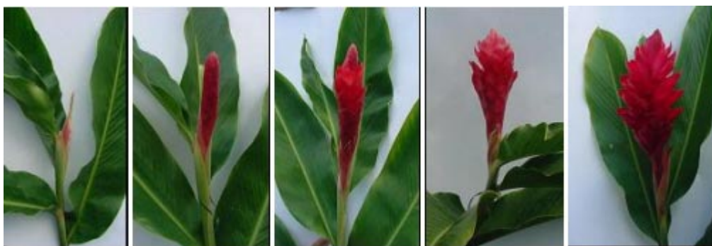
Figura 1. Escala de notas para descrição do estágio de desenvolvimento das hastes florais de A. purpuratum : a - emissão da inflorescência; b - inflorescência totalmente emitida; c - inflorescência abrindo; d - inflorescência com 2/3 das brácteas abertas (ponto de corte); e - inflorescência com mais de 2/3 das brácteas abertas.

TEXEIRA, M. do C.F. Curso prático de pós-colheita para flores tropicais. In: SEBRAE. Floricultura em Pernambuco . Recife: SEBRAE/PE (Série Agronegócio). 11-16. 2002.