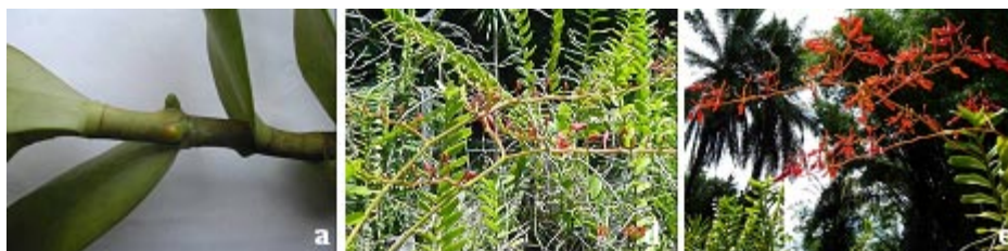
Figura 5. Escala de notas para descrição do estágio de desenvolvimento das hastes florais de R. coccinea : a - surgimento da gema da haste floral; d - haste floral com botões verdes e vermelhos; e - abertura das flores (ponto de corte).

Figure 4. Scale note describing Z. spectabilis flower stems development stages: a - inflorescence emission; b - inflorescence with diameter greater than length; c - inflorescence with length equal to diameter; d - inflorescence with length than diameter (harvest point).