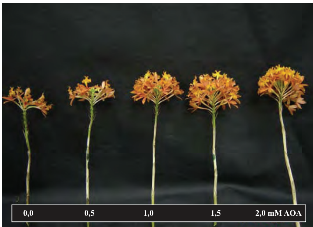
Figura 2. Efeito de diferentes concentrações de AOA, via pulverização, sobre a longevidade de inflorescências de E. ibaguense , após 5 dias de vaso. Viçosa, MG, 2007.

Figure 1. Longevity of E. ibaguense flowers treated with 0,0; 0,5; 1,0; 1,5 and 2,0 mM AOA by spraying (●) or pulsing (□). Viçosa, MG, 2007.