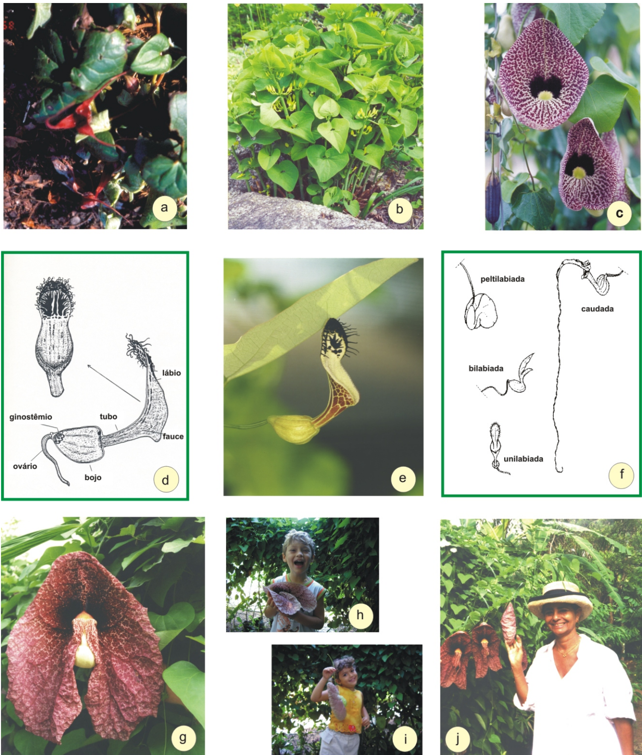
Figura 1. a. Asarum canadensis (fotografada em Estrasburgo / França); b. Aristolochia clematitis (idem); c. A. elegans ; d. Esquema das partes florais de Aristolochia ; e. A. arcuata ; f. Formas de lábios; g - j. A. gigantea : g. Flor, h-j. A curiosidade atraindo crianças e adultos.