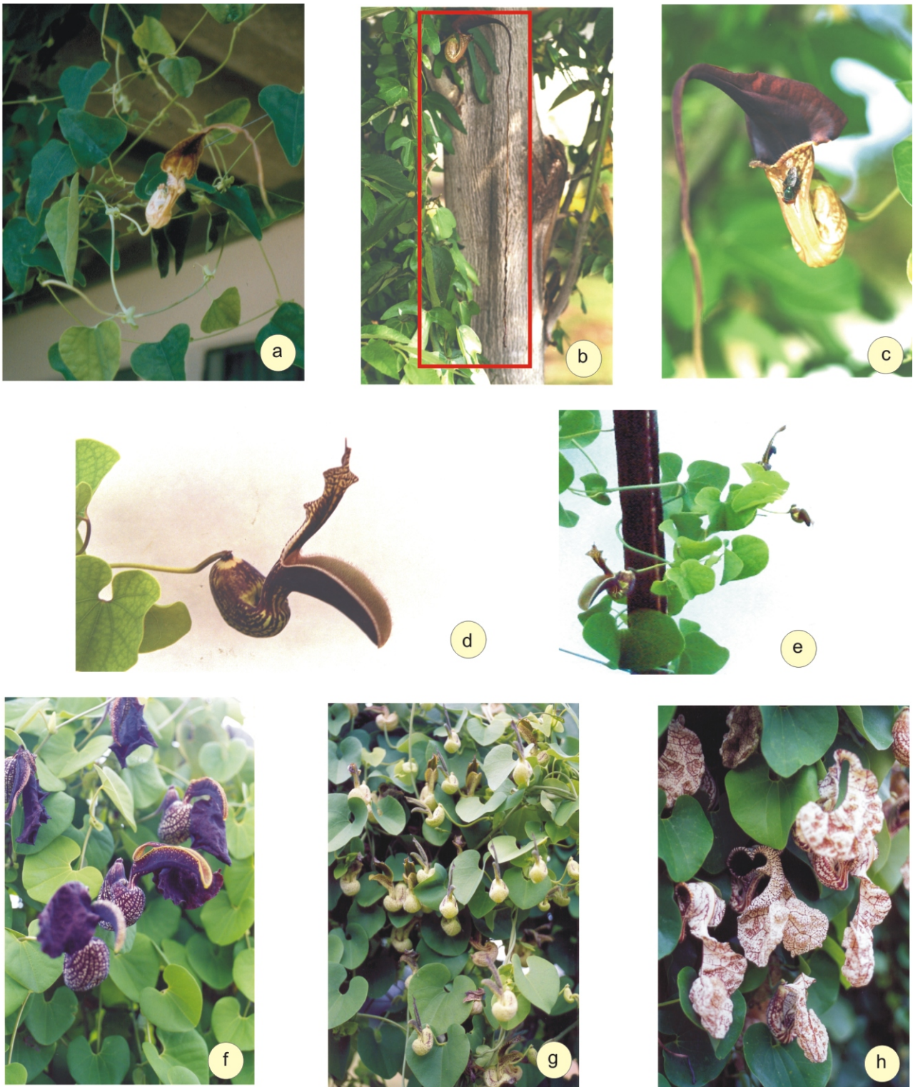
Figura 2. a. Aristolochia paulistana ; b. A. macroura , destacando o tamanho do lábio superior - retângulo vermelho; c. A. macroura (em detalhe); d - e. A. esperanzae : e. Flor, f. Hábito da planta em cultivo; f. A. galeata ; g. A. gehrtii ; h. A. cymbifera .