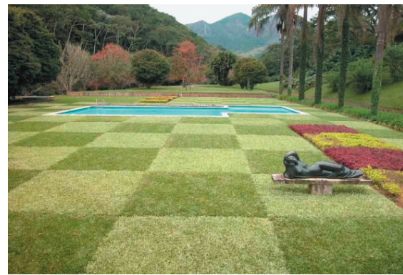
Figura 2. O jardim após a reforma de 2002, vendo-se o contraste entre as diferentes gramas – Fotos Luiz Marigo.

Figure 2. The garden after the 2002 reform, seeing the contrast between the different grasses – Photos Luiz Marigo.