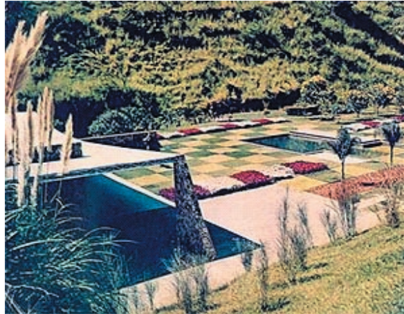
Figura 3. A piscina original, forrada com pastilhas pretas e os canteiros, ainda com cinerárias – Foto tirada do site www.google.com.br , autor desconhecido.

Nesta reforma foram trocados os azulejos, colocada nova iluminação, instalados filtros e bombas necessárias, além de a impermeabilização ter sido toda refeita e o deck, em ipê, ter sido reformado e tratado.