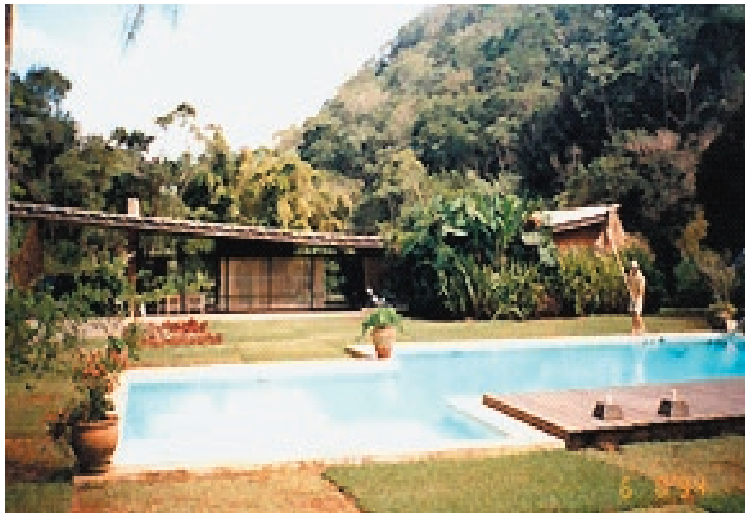
Figura 1. O jardim em 1994, quando a propriedade foi adquirida pelo seu atual proprietário – Foto acervo do proprietário. Figure 1. The garden in 1994, when the property was acquired by its current proprietor – Photo quantity of the proprietor.

O jardim da Fazenda Tacaruna, antiga residência Cavanelas, localizada em Pedro do Rio, distrito de Petrópolis, é um dos mais importantes jardins de Burle Marx. Em se tratando de jardim residencial pode-se afirmar que se trata do mais importante de todos os que ele projetou. Ocupando cerca de 50 mil metros quadrados, limitado entre a estrada e um rio que corta a propriedade em seu sentido maior, o jardim está inserido num terreno de aproximadamente 210 mil metros quadrados que, excetuando-se a área paisagisticamente tratada, é composta por uma magnífica área de Mata Atlântica.