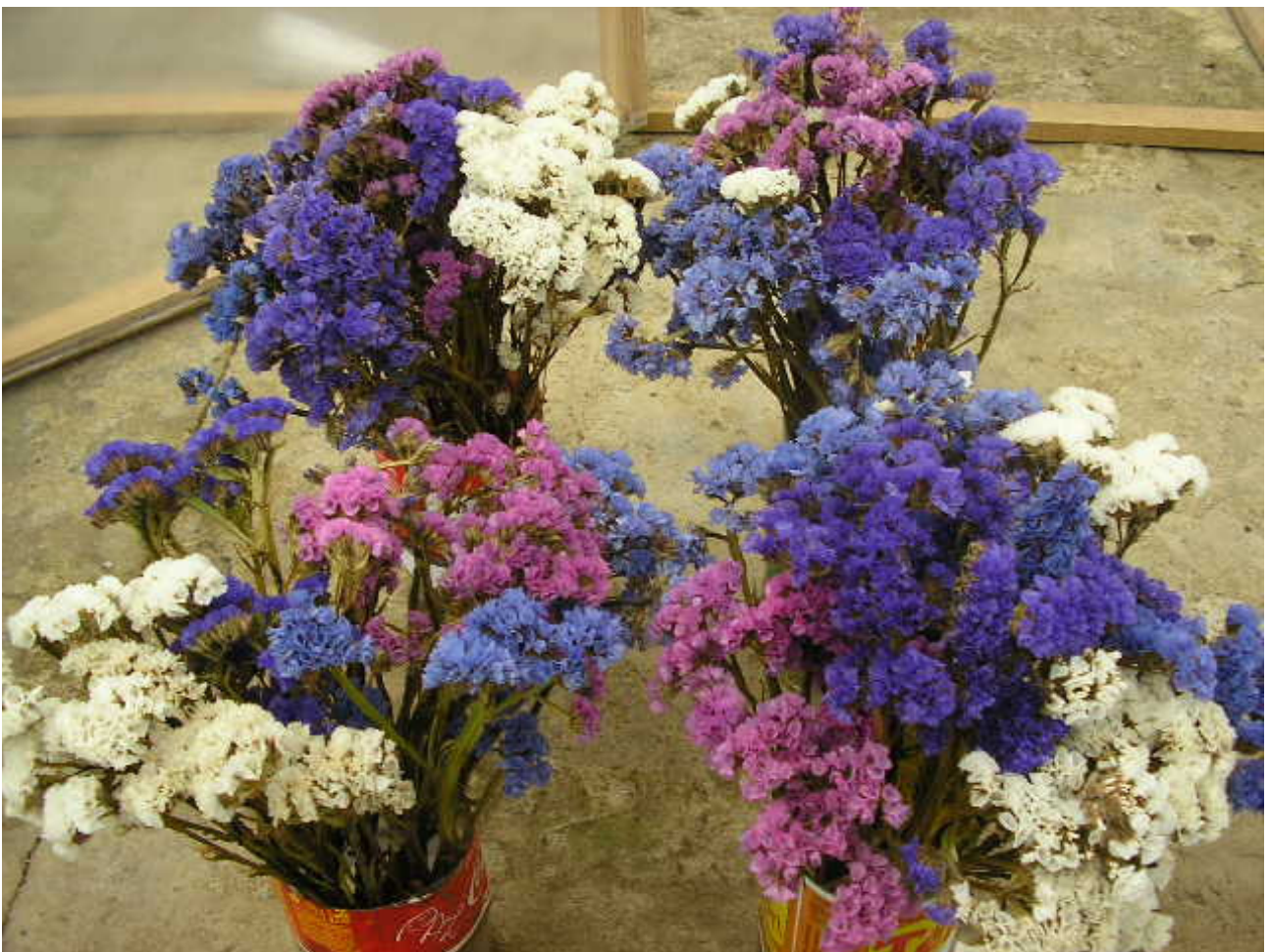
Figura 4. Hastes florais de Limonium sinuatum no período final de conservação em solução de sacarose. Figure 4. Limonium sinuatum of flower stalks in final period of preservation with sucrose solution.