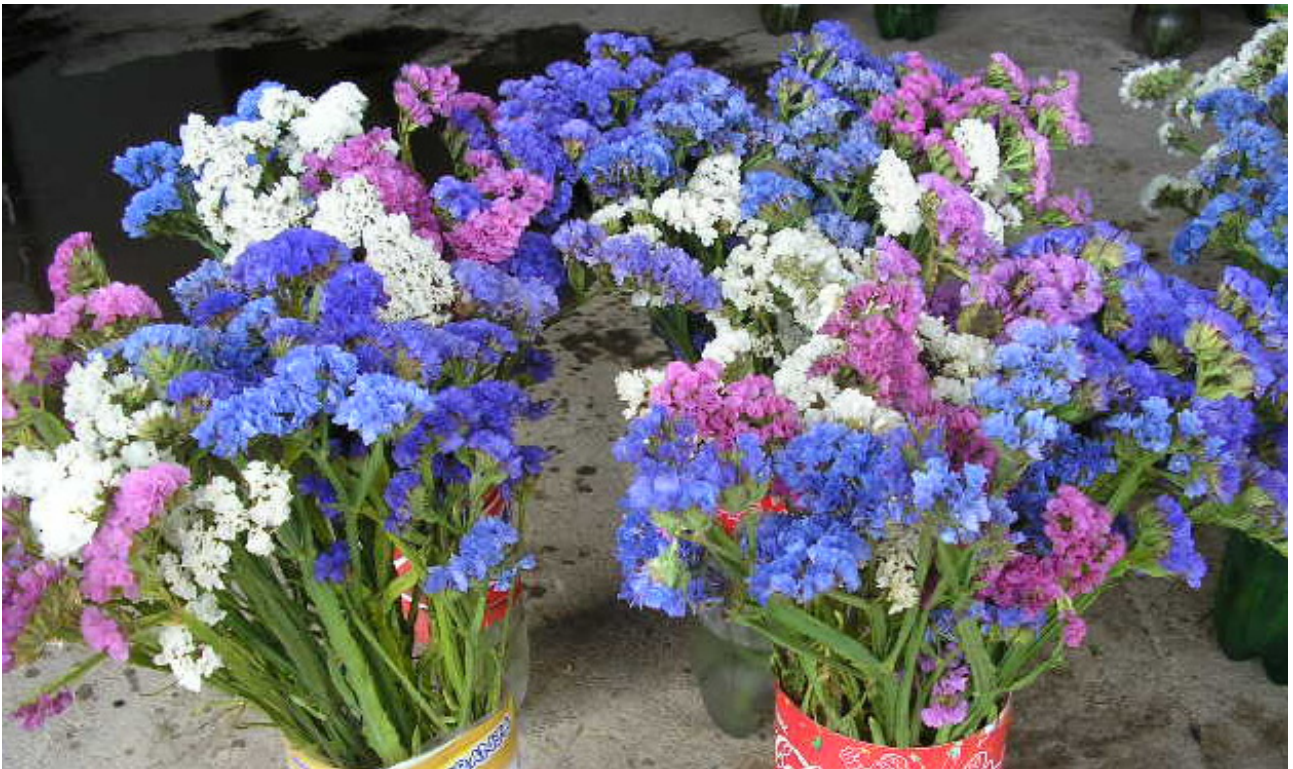
Figura 3. Hastes florais de Limonium sinuatum no início do período de conservação em solução com sacarose. Figure 3. Limonium sinuatum of flower stalks in early storage period with sucrose solution.