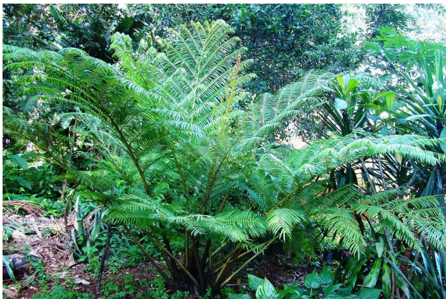
Figura 1. Angiopteris evecta .

http://www.issg.org/database/species/ecology.asp?si=1550&fr=1&sts=&lang=EN , acessado em 14/02/2011