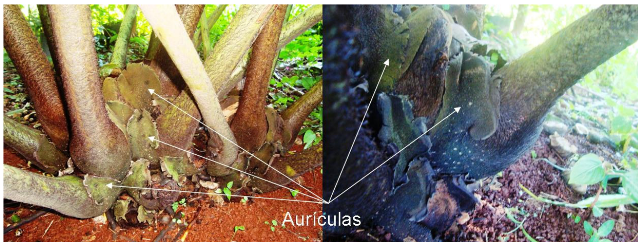
Figura 2. Aurículas nas bases das frondes.